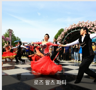
로즈 왈츠 파티