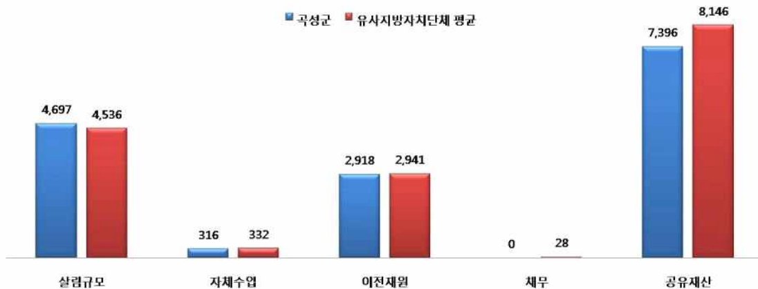
유사 지방자치단체 살림살이 규모비교(단위:억원)